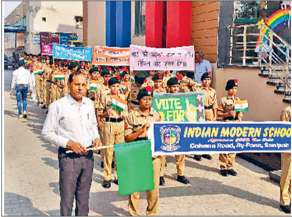
सोनीपत। इंडियन स्कूल में रैली को हरी झंडी दिखाकर रवाना करते प्रचारार्थ।