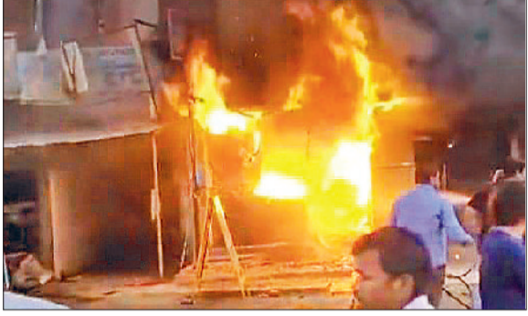
सोनीपत। अस्पताल में लगी आग। मुखल रोड पर दुकान ने आग लगने की सूचना मिली थी सूचना के बाद तीन गाड़ियां दमकल विभाग की मौके पर पहुंची। आगे एक दांतों के अस्पताल में लगी हुई थी। दमकल कर्मचारियों ने समय रहते आग पर काबू पा लिया। अस्पताल संचालक आग लगने से हुए नुकसान की जानकारी ली जा रही। निगेद कुमार सब फायर ऑफिसर।

मुखल रोड पर स्थित शिव दांतों के अस्पताल में देर शाम हुई आग की घटना से मर्ची अफरा-तफरी