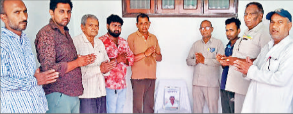
गोहाणा। सुखदेव थापर के चित्र पर पुष्प अर्पित करते नागरिक।