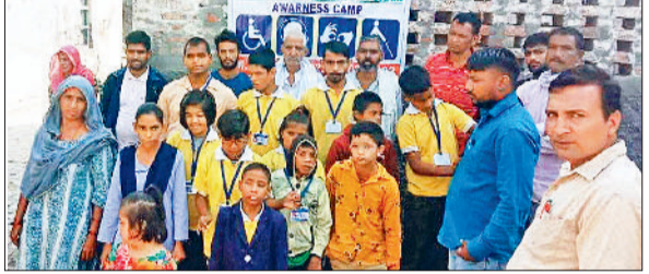
गोहाणा। कार्यक्रम में अपने गुरुजनों व परिवारजनों के साथ दिव्यांग बच्चे।