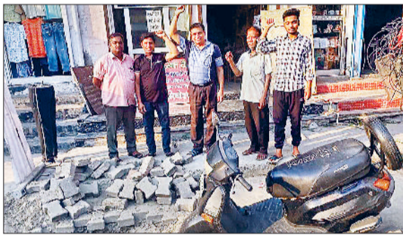
फाइबर दबाने के दौरान खोदे गए गड्ढों से परेशान रोष व्यक्त करते हुए।

हरिभूमि न्यूज ▶ गन्नीर पिछले दिनों नगरपालिका रोड पर मशीनों द्वारा दबाई गई इंटरनेट फाइबर दबाने के लिए खोदे गए गड्ढे हादसे का कारण बन रहे हैं। इस तरफ न तो नगरपालिका का कोई ध्यान है, न ही फाइबर दबाने वाली कंपनी का। दोनों की मनमानी का खामियाजा लोगों व दुकानदारों को भुगतना पड़ रहा है। लोगों ने प्रशासन से मांग की है कि फाइबर दबाने के दौरान खोदे गए गड्ढों को